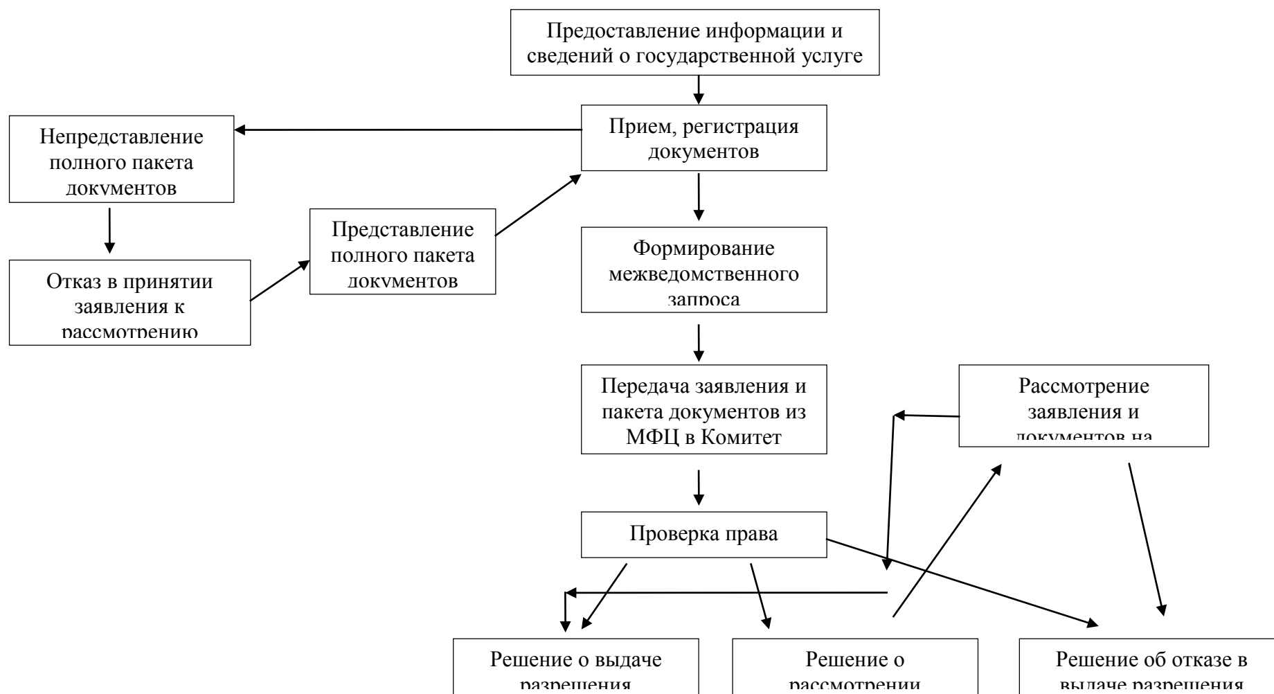
Блок-схема заключения договоров доверительного управления имуществом