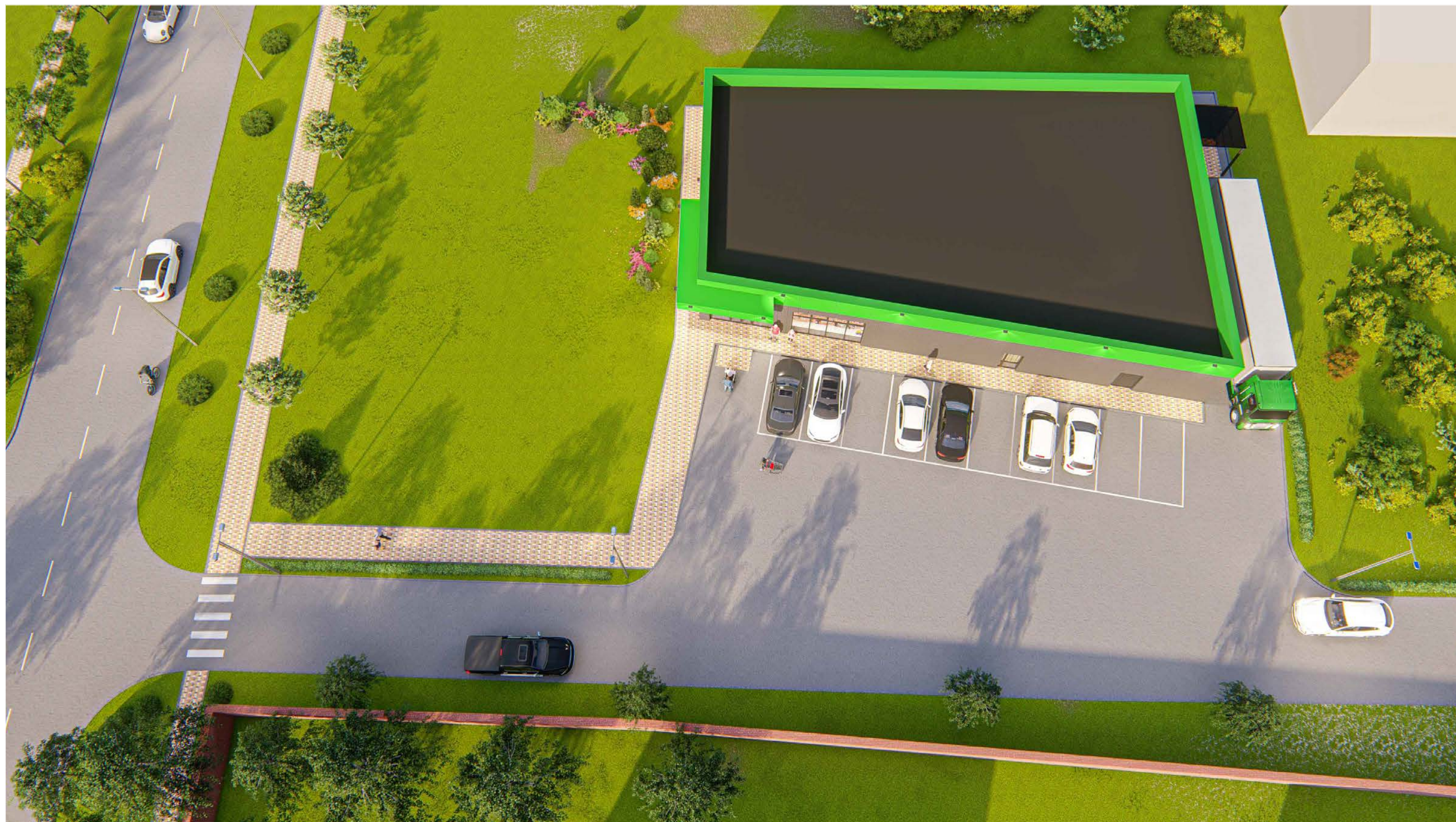
Перспективный вид №2