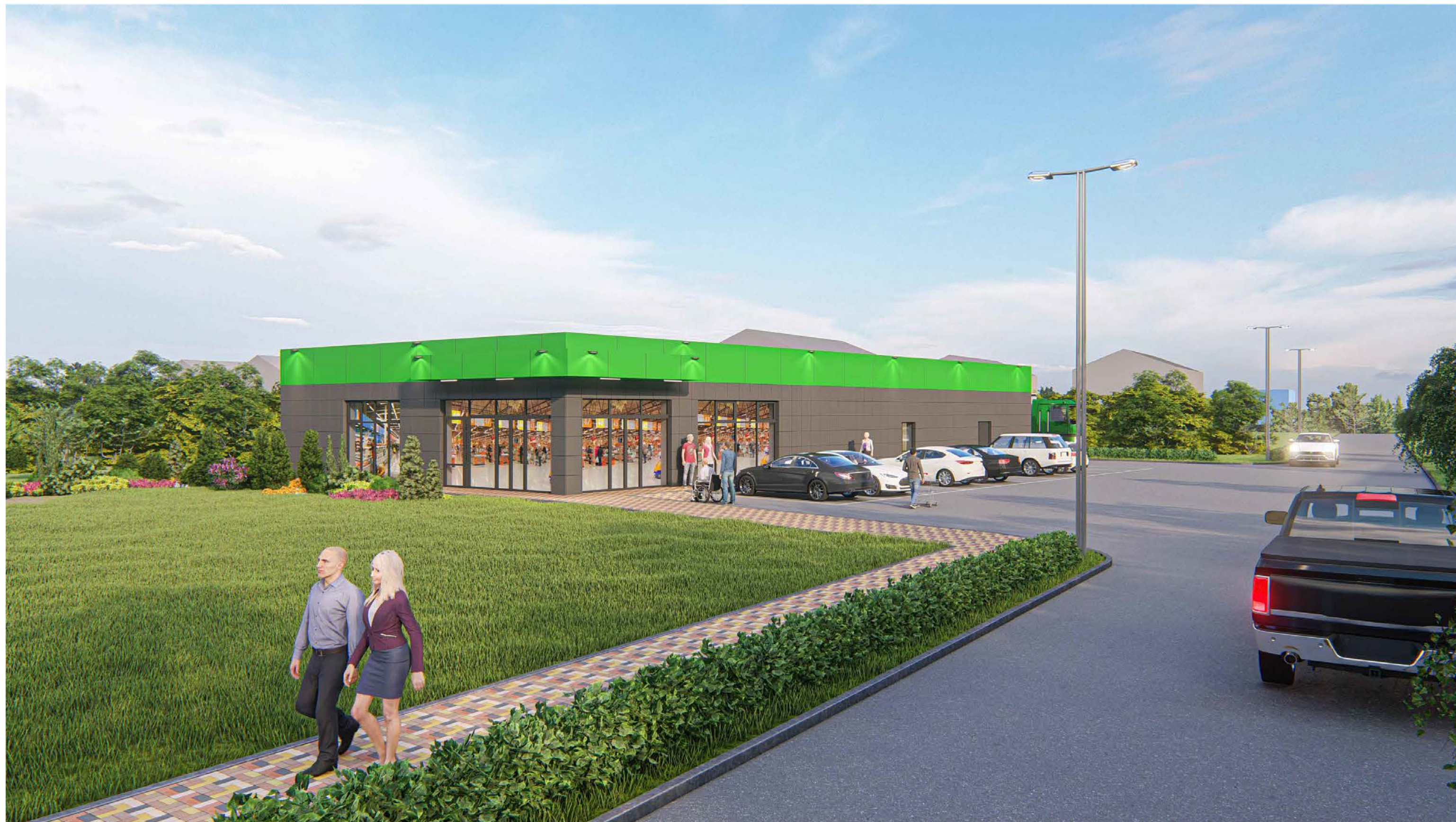
Перспективный вид №1