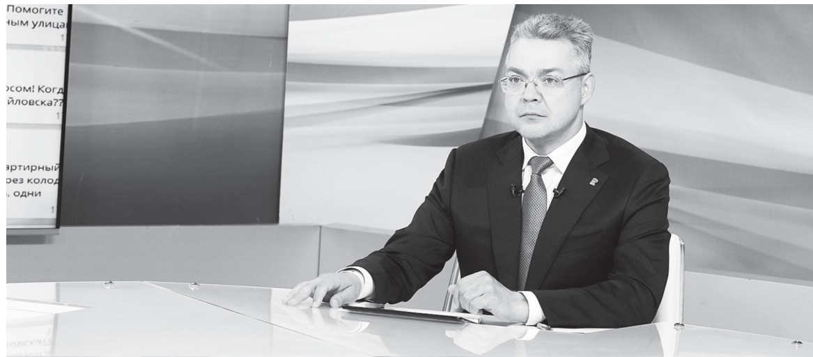
Губернатор Ставропольского края Владимир Владимиров

- Та работа, которую мы делаем, нас только подстегивает, чтобы делать еще больше. Видим