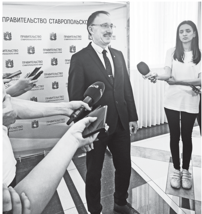
Министра образования Ставропольского края Евгения Козюра