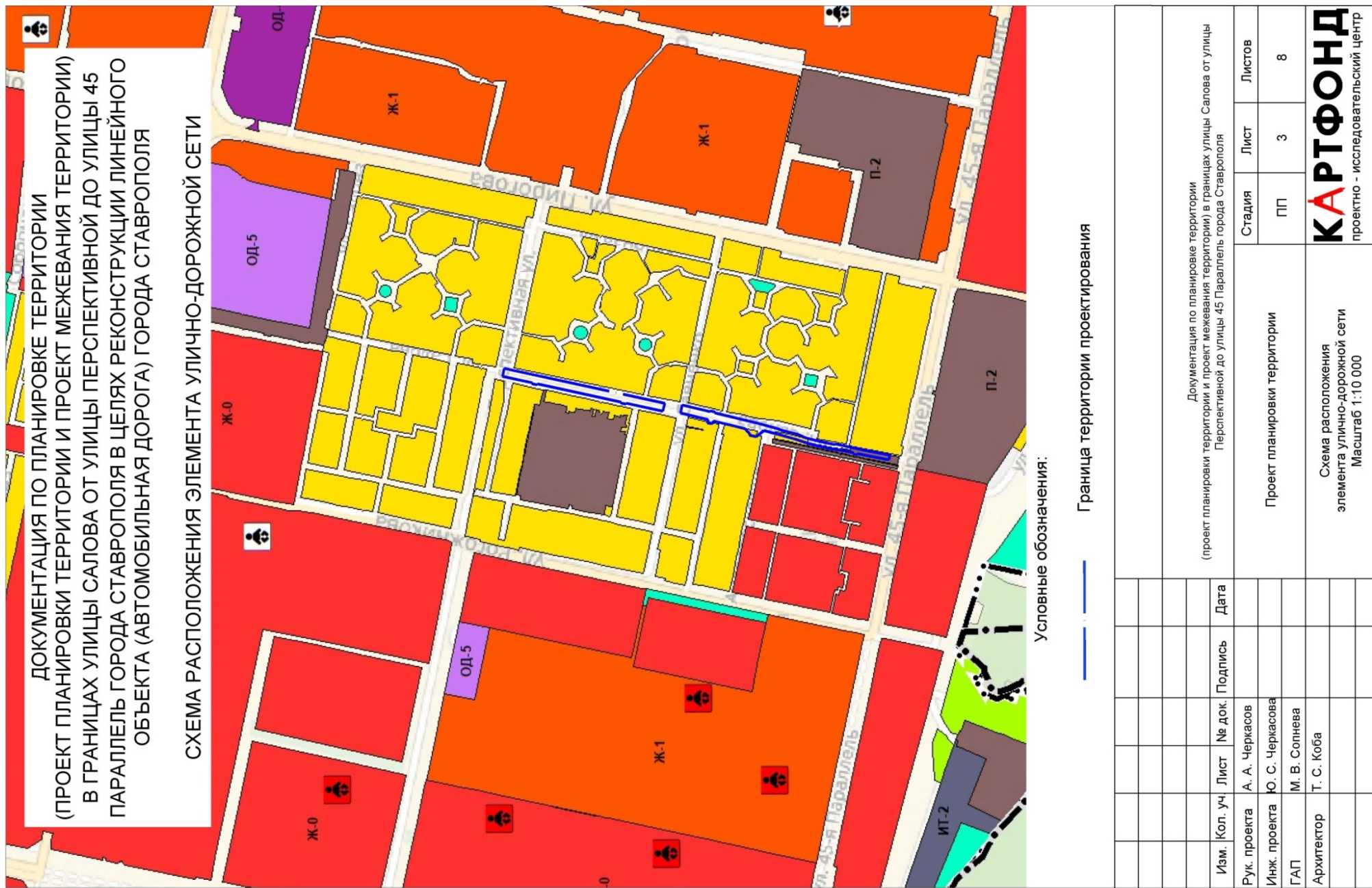
СХЕМА расположения элемента улично-дорожной сети

к документации по планировке территории (проекту планировки территории и проекту межевания территории) в границах улицы Салова от улицы Перспективной до улицы 45 Параллель города Ставрополя